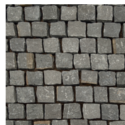
Grau Pflaster, gespalten