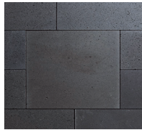
Dunkelgrau Platten, feingeschliffen