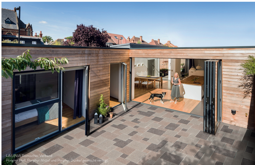
LA LINIA Römischer Verband Porphyr Hell, Porphyr Mittel und Porphyr Dunkel gemischt verlegt.