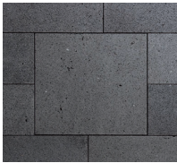
Dunkelgrau Platten, diamantgeschliffen