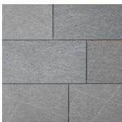
Grau Platten, geflammt