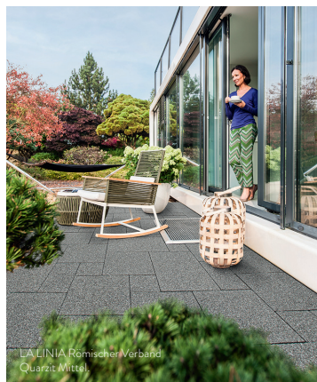
LA LINIA Römischer Verband Quarzit Mittel.