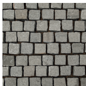
Grau Pflaster, geflammt